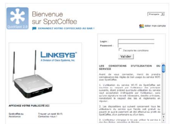
Fig 3 – Page d'accueil – authentification des utilisateurs