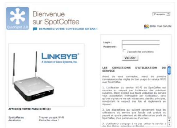
Fig 3 – Page d'accueil – authentification des utilisateurs